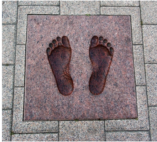
Baltic Way Vilnius, Litauen

„Der baltische Weg“, an den dieser Gedenkstein in Vilnius erinnert, war der friedliche Protest, der sich am 23. August 1989 erhob. Etwa zwei Millionen Menschen formten eine über 600 Kilometer lange Menschenkette durch die drei baltischen Staaten Estland, Lettland und Litauen, um die Weltaufmerksamkeit auf das Schicksal ihres besetzten Landes zu lenken. Diese „längste Menschenkette der Welt“ war im wahrsten Sinne des Wortes ein entscheidender Schritt zur Befreiung des Baltikums.